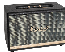
Marshall Stanmore II Voice