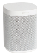
Sonos One Gen 2