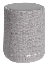
Harman Kardon Citation One