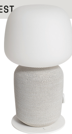
IKEA E1776 SYMFONISK