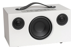
Audio Pro ADDON C5