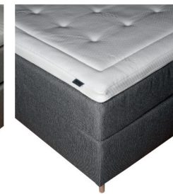
Mio Cape Farewell